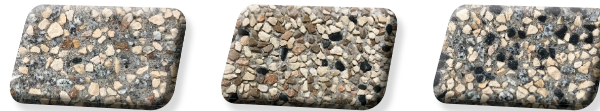
Minéra 4/6 1/3 B-G-O