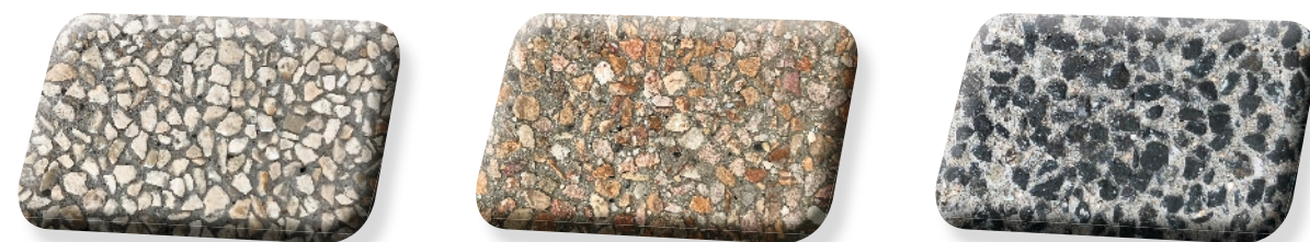
Minéra 4/6 Blanc