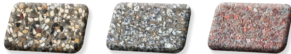
Minéra 4/6 Local