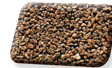
4/6 Perméa Minéra Ocre

LHYA Perméa Minéra est une variante monochrome à polychrome selon le panachage de gravillons de nos produits LHYA Minéra .