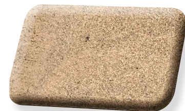
Surfa Ton Pierre