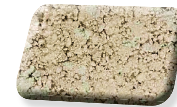
0/6 Perméa Stab Ocre

LHYA Perméa Stab est un sable stabilisé au ciment de couleur ocre.