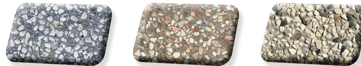
Minéra 4/6 70/30 B-G