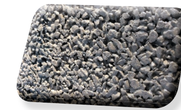
4/6 Perméa Surfa Gris

LHYA Perméa Surfa est une variante colorée dans la masse selon la palette de couleur de nos produits LHYA Surfa .