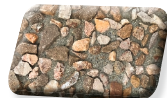
Minéra 6/10 ocre